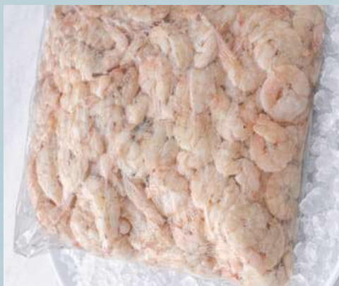
เนื้อกุ้งทะเล (โศคัก) (Wild-caught sea shrimp)