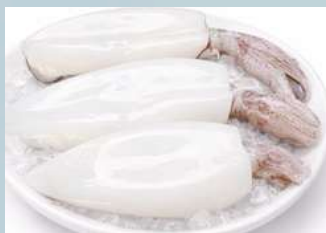
หมึกกล้วย (Indian Squid)