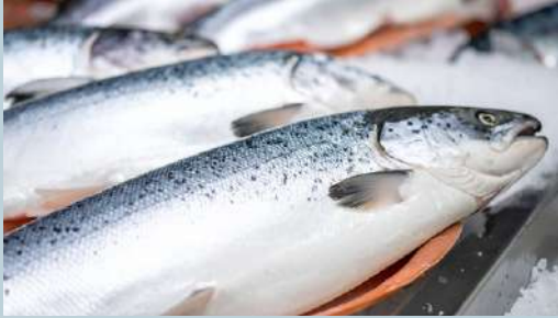
ปลาแซลมอน (Salmon)