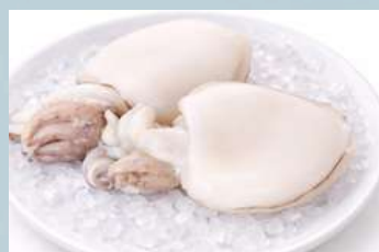
หมึกกระดอง (Cuttlefish)