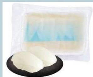
หมึกสไลด์ซาซิมิ (Sliced Ika)