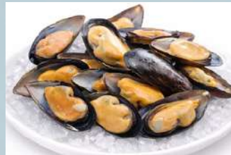
หอยแมลงภู่ ชิลี (Chilean Mussels)