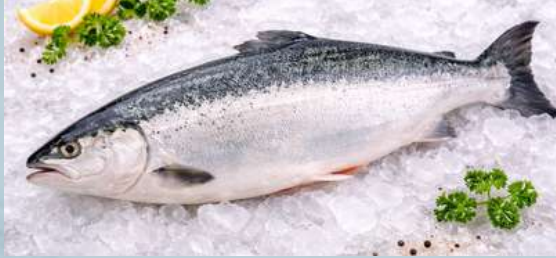
ปลาเทราต์ (Trout)