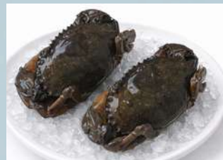
ปูนิ่ม (Soft Shell Crab)