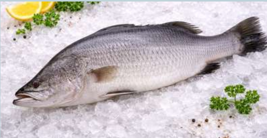
ปลากระพง (Barramundi)