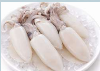
หมึกหอม (Fresh Bigfin Reef Squid)