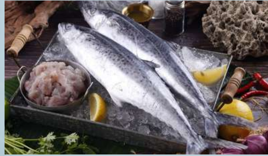
เนื้อปลาอินทรีย์ขูด (Mackerel)