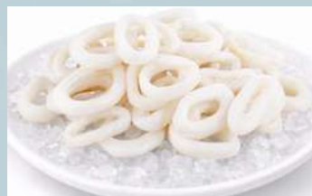
หมึกวง (Squid Rings)