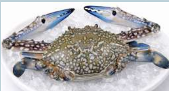
ปูม้า (Blue Swimming Crab)