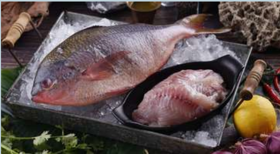
เนื้อปลาหางเหลืองแล้ (Yellow tail)