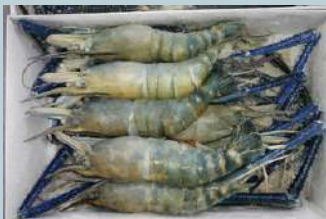
กุ้งแม่น้ำ (Freshwater Shrimp)