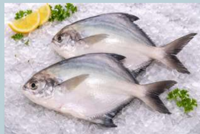
ปลากระเมียด/เต๋าเต๋ย (Pomfret)

*ไซส์/spec ตามความต้องการของลูกค้า* "Custom size available upon request."