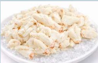
เนื้อปูแกะ (Crab Meat)

*ไซส์/spec ตามความต้องการของลูกค้า* "Custom size available upon request."