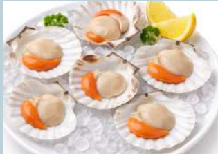
หอยเชลล์ไทย (Thai Scallop)