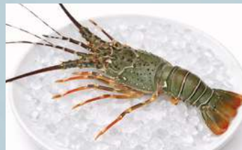
กุ้งมังกร (Green Lobster)