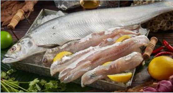
เนื้อปลาไซตอแล้ (Saito)

ปลาตัว/เนื้อปลาแล้: ปลาสด100% ส่งตรงจากทะเลภาคใต้