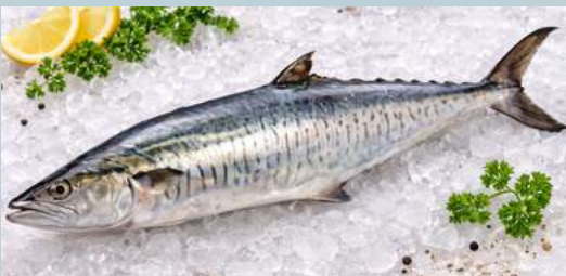
ปลาอินทรี (Mackerel)